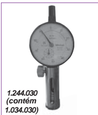
1.244.030 (contém 1.034.030)